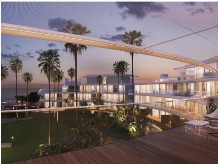
Blick von der Terrasse