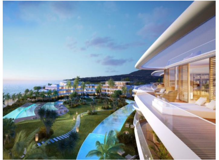
Terrasse mit traumhaften Meerblick