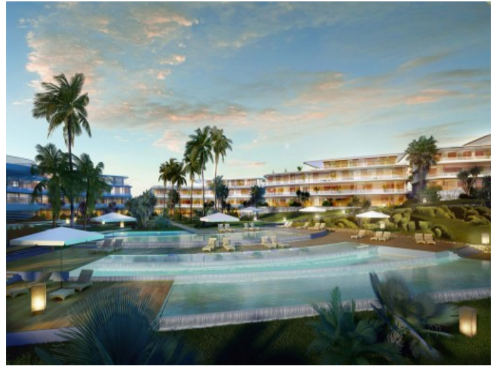
Schön angelegter Poolbereich

Alle Angaben nach bestem Wissen. Irrtum und Zwischenverkauf vorbehalten. Dieses Exposé ist eine Vorinformation, als Rechtsgrundlage gilt allein der notariell abgeschlossene Kaufvertrag.