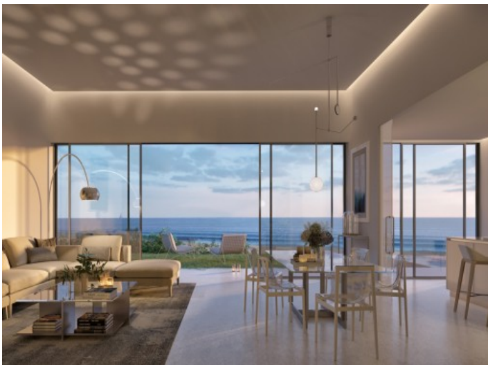
Toller Meerblick vom Wohnbereich aus