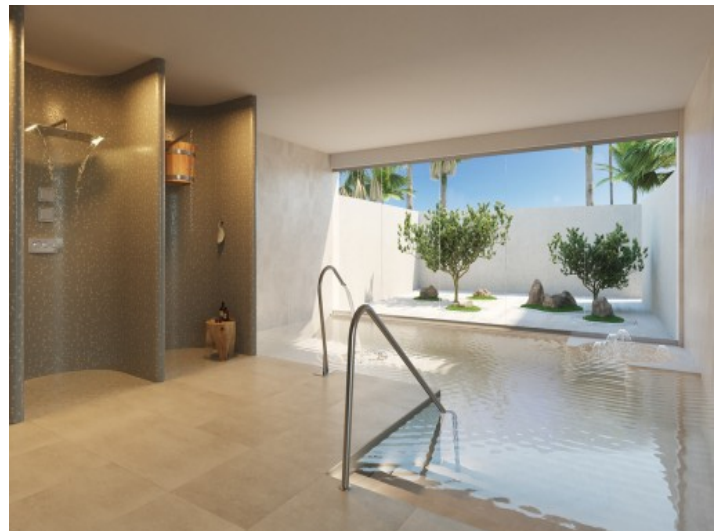
Luxuriöser Indoor Pool