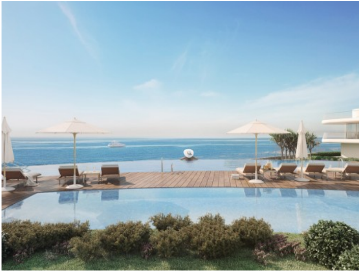
Poollandschaft in erster Meereslinie