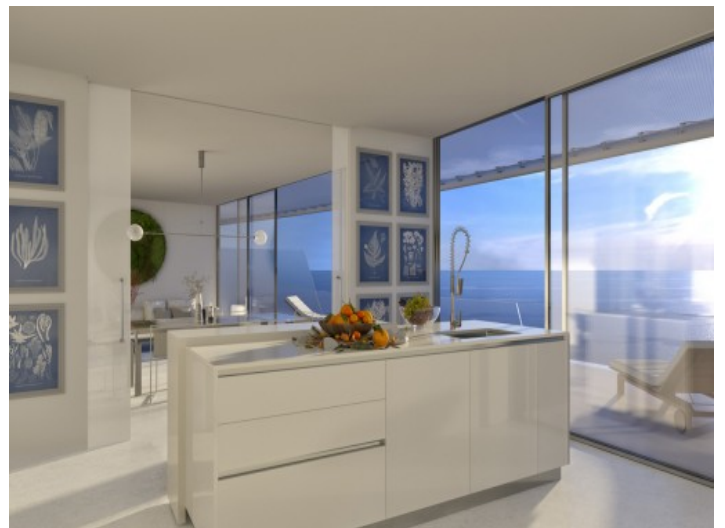
Offen gestaltete, voll ausgestattete Küche

Alle Angaben nach bestem Wissen. Irrtum und Zwischenverkauf vorbehalten. Dieses Exposé ist eine Vorinformation, als Rechtsgrundlage gilt allein der notariell abgeschlossene Kaufvertrag.