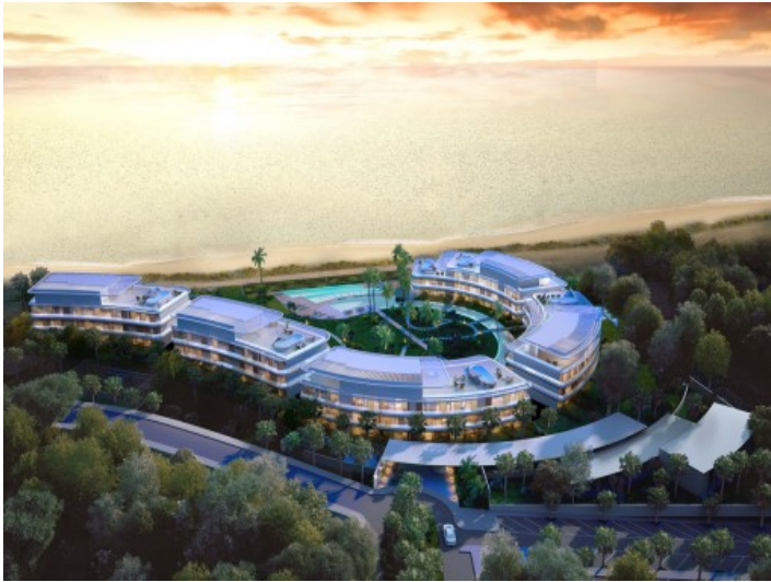
Komplex aus der Vogelperspektive